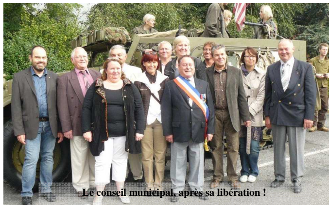
Le conseil municipal, après sa libération !